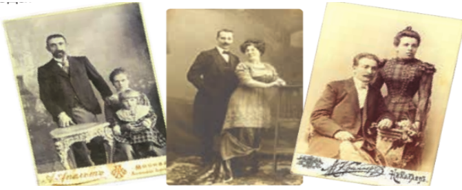
Şekil 5. Pleshakov, A. K. ve Kruchakova, E, A. (2020). Etraftaki Dünya 4.Sınıf 1. Kitap , Rusya Okulu, Provisheniye, s.20

Görselde yer aldığı üzere temizlik yapılırken erkeğe de kadına da iş düşmektedir. İş birliği içerisinde çalışılmaktadır. Ev temizliğinde iş bölümünün yapıldığı görsel ve erkeğin bulaşık yıkama (f:1) eyleminde bulunduğu görsel sadece 2. sınıf Hayat Bilgisi ders kitabında yer almaktadır. Çocukla ilgilenme (f:6) eylemi de yine sadece kadınlarla eşleştirilmemiştir. Erkekler de çocukla ilgilenme (f:5) eylemi içinde yer almaktadırlar. Bu durum çocukla ilgilenmenin sadece kadına ait bir eylem olmadığını, erkeğin de çocuklarıyla ilgilendiğini göstermektedir. Başka bir ifadeyle erkek ve kadınların aile içinde farklı görevlerde yer aldığı, ailenin içinde bir iş birliğinin olduğu, modern bir aile yapısının temsil edildiği belirtilebilir.