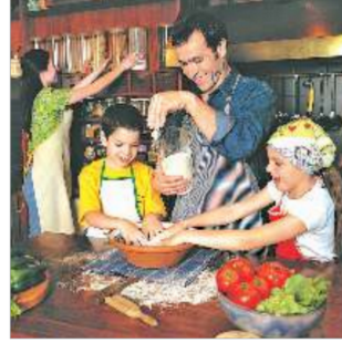
Şekil 6. Pleshakov, A. K. ve Kruchakova, E. A. (2020). Etraftaki Dünya 2. Sınıf 2. Kitap , Rusya Okulu, Provisheniye, s.43

Etraftaki Dünya ders kitabında sadece bir görselde erkek ve kadın beraber yemek yapmaktadırlar. Aynı şekilde sadece bir görselde kadın, erkek ve çocuklar ile birlikte alışverişe çıkmış olarak resmedilmiştir. İlkokul 4. sınıfa kadar okutulan Etraftaki Dünya ders kitabında kadın ve erkeğin iş birliği içerisinde yemek ve alışveriş yaptığı yalnızca bir görsel bulunmaktadır. Fakat bunların yanı sıra erkek figürünün hiçbir zaman ev temizliğinde veya mutfakta tek başına yemek yaparken gösterilmediği de saptanmıştır.