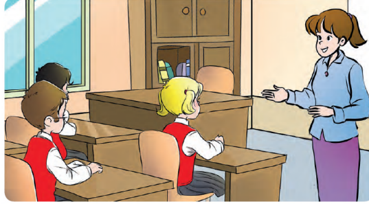
Şekil 1. Alemdar, Ç. (2021). İlkokul 1 Hayat Bilgisi Ders Kitabı , Pasifik Yayınları, s.37

ikinci olarak polislik mesleği ile eşleştirilmiş, fakat eşleştirmelerde kadın polis örneğine rastlanmamıştır.