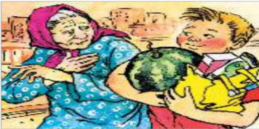
Şekil 7. Pleshakov, A. K. ve Kruchakova, E. A. (2020). Etraftaki Dünya 2. Sınıf 1. Kitap , Rusya Okulu, Provisheniye, s.1

Hayat Bilgisi ders kitabında erkek; çocukla ilgilenme, temizlik yapma ve bulaşık yıkama eylemlerinde bulunurken, Etraftaki Dünya ders kitabında erkeğin tek başına çocukla ilgilendiği, temizlik yaptığı ve bulaşık yıkadığı görsel yer almamaktadır. Sadece kadınlar ev işleri ve çocuk bakımıyla eşleştirilmiştir. Dolayısıyla Hayat Bilgisi ders kitabının daha modern bir aile yapısı oluşturduğu söylenebilir.