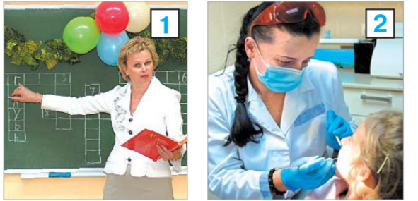
Şekil 2. Pleshakov, A.K. ve Kruchakova, E. A. (2020). Etraftaki Dünya 2. Sınıf 1. Kitap , Rusya Okulu, Provisheniye. s.123.

Etraftaki Dünya ders kitaplarında kadınlar en çok öğretmenlik (f:15) mesleği ile eşleştirilmişlerdir. Kadınlar birçok kez öğretmenlik mesleğiyle eşleştirilirken, erkekler bir kez sadece müzik öğretmeni olarak sunulmuştur. Bu durum Rusya’da ilkökul öğretmenlerinin cinsiyet bağlamında dağılımıyla uyumluluk göstermektedir. Zira Rusya’da kadın ilkökul öğretmenlerin oranı %99.12 iken erkek öğretmenlerin oranı %0.89’dur (Statista, 2021a). Bu bağlamda görev yapan erkek öğretmen azdır, bu durum ders kitaplarına yansımıştır.