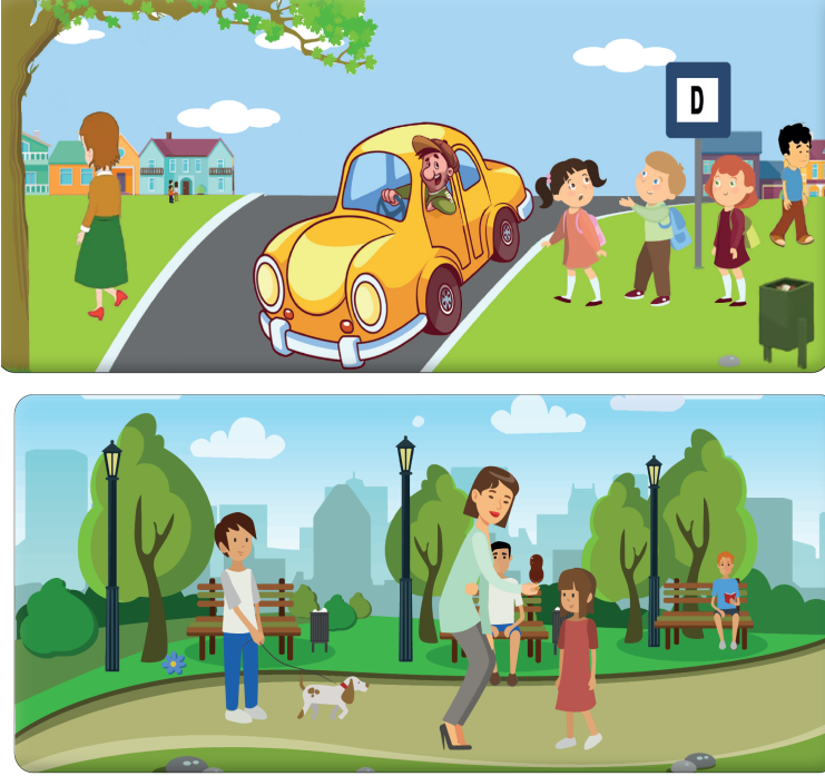
Şekil 8. Çelikbaş, E., Gürel, F. ve Özcan, N. (2021). İlkokul 3 Hayat Bilgisi Ders Kitabı , Devlet Kitapları, s.104-104.

Etraftaki Dünya ders kitabında alışveriş yaparken, otobüse binerken ve yaya geçidinden geçerken yardıma ihtiyaç duyan (f:4) yaşlı kadın imajı vardır. Fakat yardıma ihtiyaç duyan erkek imajına yer verilmemiştir.