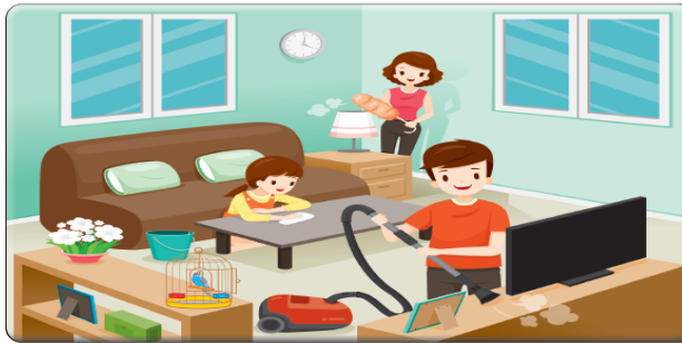
Şekil 4. Çelikbaş, E., Gürel, F. ve Özcan, N. (2021). İlkokul 3 Hayat Bilgisi Ders Kitabı, Devlet Kitapları , s.54

Hayat Bilgisi ders kitabında “kutlama” eyleminin fazla olmasının sebebi aile bireylerinin bayram ve düğünlerde bir araya gelmesinden ötürü olabilir. Kadınların kutlama ve dans etmeden sonra en çok gösterildiği eylem ve uğraş; çocukla ilgilenmek (f:6), alışveriş yapmak (f:4), ikramda bulunmak (f:4), müze gezmek (f:4), yemek yemek (f:4) şeklindedir. Buna karşın kadınlar; yardım etmek, tamir etmek, bulaşık yıkamak gibi uğraş ve eylemlerde gösterilmemişlerdir. Kitaplarda araba kullanma (sürücü) eylemi kadınlarla (f:2) eşleştirilirken erkeklerle (f:4) eşleştirilmiştir. Fakat kadınlarla eşleştirilen araba kullanma eylemi tesadüf o ki araba kazası içeriğiyle verilmiştir. Yani kadın figürü görseli arabayla seyir halindeyken verilmemiştir. Hâlbuki günümüzde kadınlar sürücü olarak trafikte yoğun biçimde yer almaktadırlar. Bu temsillerin yanı sıra ikram etme eylemi sadece kadınlarla eşleştirilmiş, erkekler ikram etme eylemi içerisinde gösterilmemiştir.